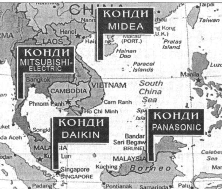
Карта наступления на жару 2008

Не успело закончиться сравнительно прохладное лето 2007-го года, как наступила осень – пора урожая, маленькой передышки, переосмысления событий и выработки стратегии нового сезона – «Весна-лето – 2008».